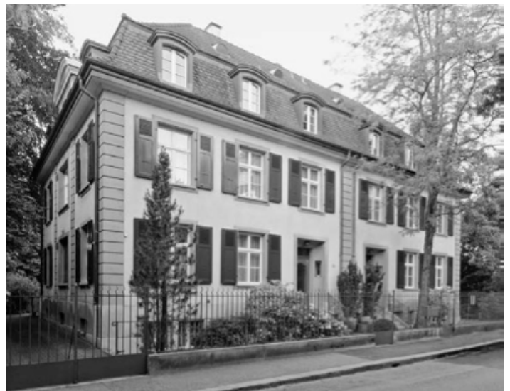
Unser Domizil am Rennweg